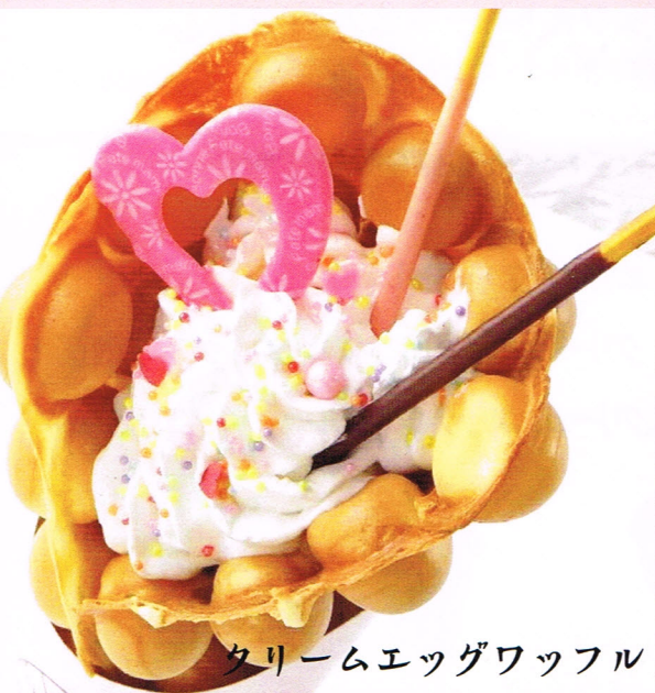
クリームエッグワッフル