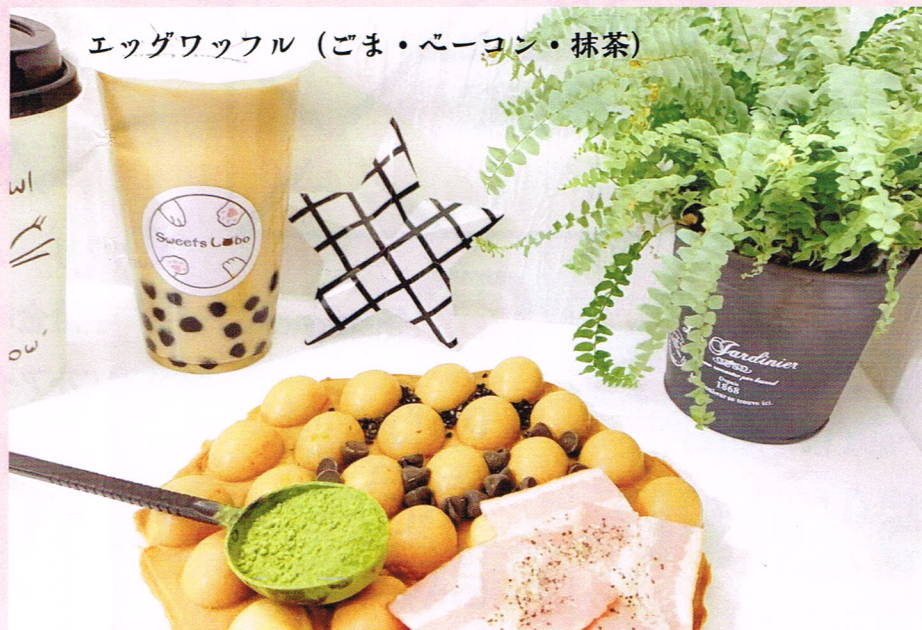
エッグワッフル（ごま・ベーコン・抹茶）