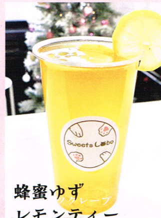
蜂蜜ゆず レモンティー