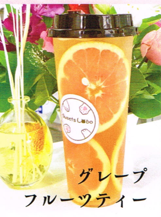
グレープ フルーツティー